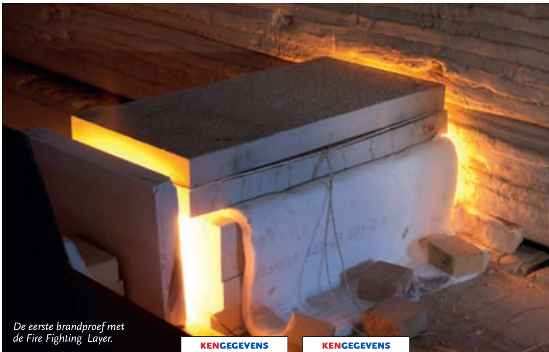
De eerste brandproef met de Fire Fighting Layer.

Tot nu toe is de Fire Fighting Layer nog niet in een project toegepast. ‘Maar er is wel veel interesse vanuit de bouwwereld’, verzekert Roelfsema. ‘Het beleid van de overheid is erop gericht om overwegen waar mogelijk te sluiten en te vervangen door een tunnel of brug. Als er brand uitbreekt in een tunnel die voorzien is van onze Fire Fighting Layer, kunnen treinen daar direct weer overheen rijden.’ ●